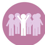
Place dans la société