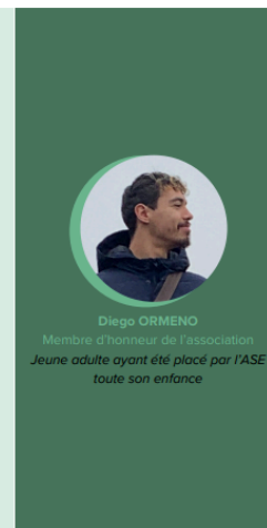
Les membres du Conseil d'Administration