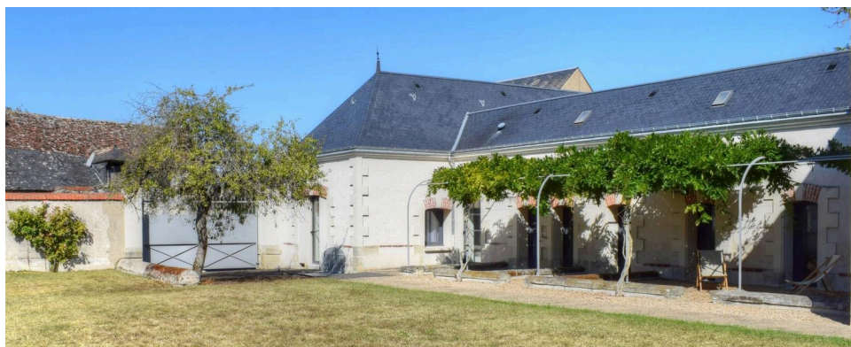
Vue extérieure du gîte (proche de Sainte-Maure de Touraine) où se dérouleront les séjours et week-ends du dispositif Emeraude

Ainsi, dès juin 2024, une grande partie de l'équipe de bénévoles s'est mobilisée pour travailler au montage du premier dispositif de séjours loisirs à visée éducative : " Emeraude ". Ce dispositif accueillera des groupes de 6 jeunes (6 à 17 ans) placés par l'ASE - avec ou sans handicaps et/ou troubles du comportement - sur des séjours d'une durée d'un week-end ou d'une semaine de vacances scolaires. Parmi les objectifs de ce projet, on compte l'amélioration de l'offre d'accès au loisirs pour ces jeunes (tout en favorisant le regroupement des fratries placées séparément le cas échéant), mais aussi l'amélioration de l'accès au répit pour les assistants familiaux et au relais professionnel pour les Établissements Médico-Sociaux (ESMS) qui en témoigneraient le besoin. Ouverture du dispositif prévue pour le premier trimestre 2025 , à raison de 20 dates (réparties sur 15 week-ends et 7 semaines de vacances).